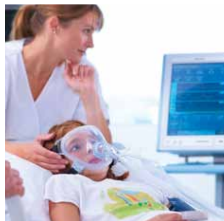
Применение НВЛ в педиатрии